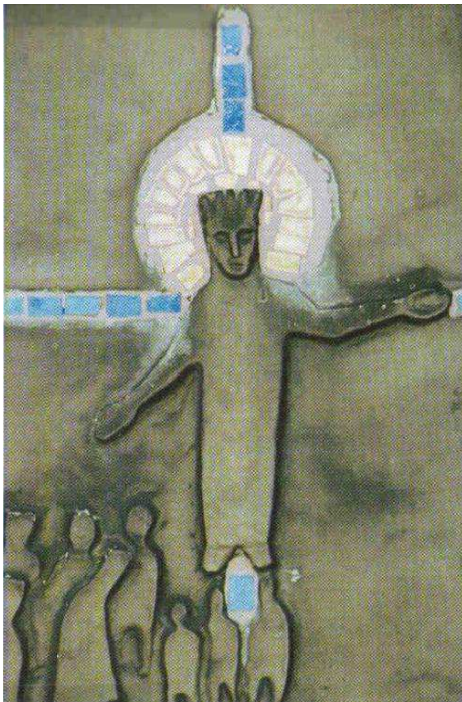
Kirchenportal der Christus-König-Kirche in Borken-Gemen