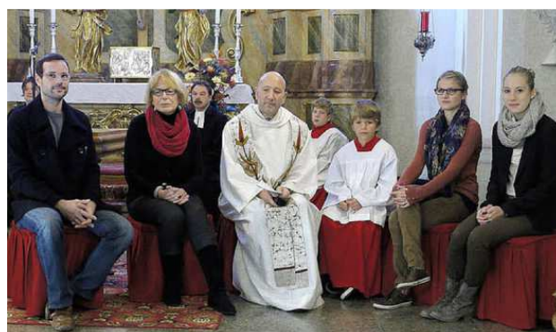
[100 Jahre St. Josef, Waldkirch, ]

Eines der ausdrucksstarken Bilder, mit denen Jesus über die spätere kirchliche Gemeinschaft seiner Jüngerinnen und Jünger gesprochen hat, ist das des Weinstocks und der Rebzweige, das der Apostel Paulus später in der Leib-Christi-Kirchenlehre aufgegriffen und weiterentwickelt hat.