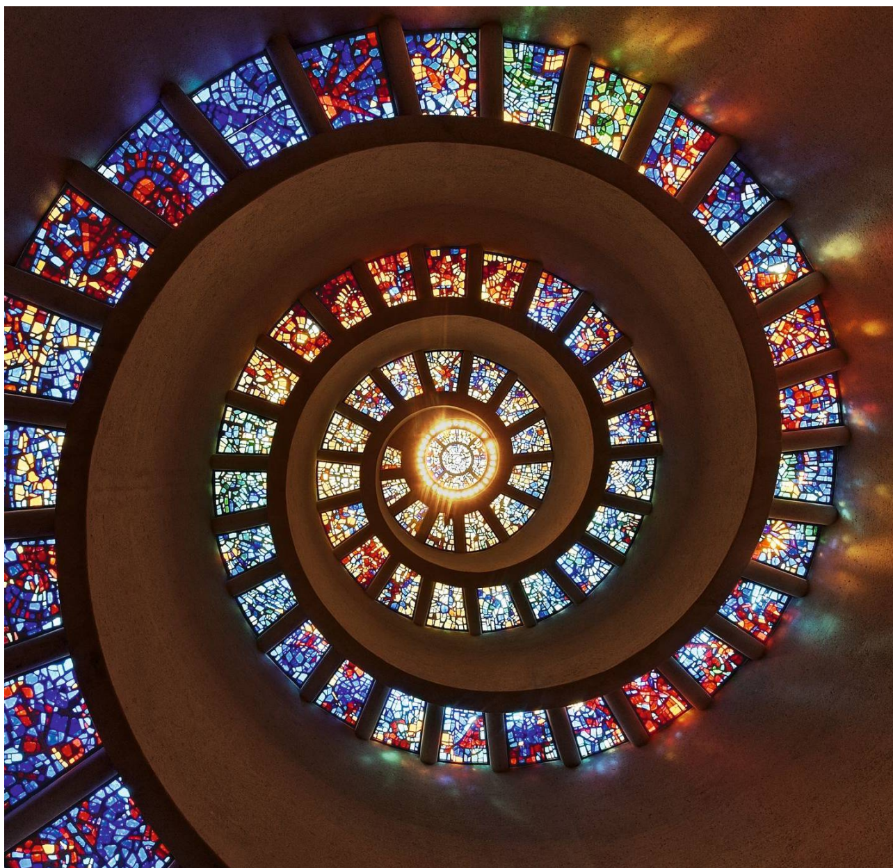
„Glory Window“ in der „Thanksgiving-Kapelle“ im Zentrum von Dallas, Texas.

Durch das Dunkel der Nacht ins Licht der Hoffnung